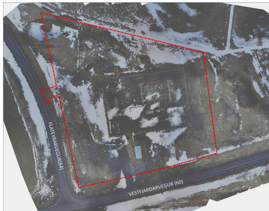
Mynd 2 Afmörkun deiliskipulagsins, sýnd með rauðri brotalína. Svæðið er um 15,6 ha að stærð.

Skv. minjavefsjá Minjastofnunar Íslands eru engar skráðar minjar á deiliskipulagssvæðinu. Lóðin liggur á um 35 ára gömlum malarpúða, þannig ólíklegt er að fornminjar sé þar að finna.